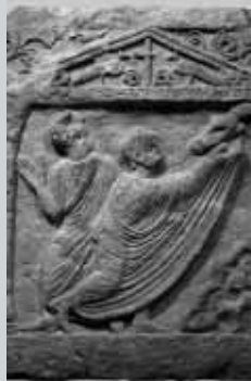
Raffigurazione in un sarcofago bizantino

Le religioni, portatrici di un messaggio universale, sono le più esposte alle contrapposizioni per il loro riferimento all'assoluto e alla verità. Se la verità è unica e viene da Dio, come è possibile tollerare l'errore e la diversità? Se la religione non è solo un fatto interiore o di coscienza, ma anche un fatto sociale, come non perseguire forme culturali ispirate ai valori religiosamente professati? Sono interrogativi che ieri hanno giustificato le