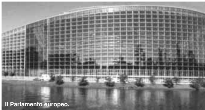
Il Parlamento europeo.

Si favoriscono gli strumenti offerti dalla cultura e dall'educazione, perciò si pensa di rafforzare i corsi di lingua tedesca in Francia e viceversa, di realizzare scambi di studenti e di docenti, borse di studio perché gli studenti tedeschi possano studiare in Francia e quelli francesi in Germania, sono creati vari comitati di scienziati e di storici franco-tedeschi che si incontrano, discutono e fanno progetti assieme. Sembrano cose di minor rilievo, eppure sono proprio queste cose che sono in grado di radicarsi per condurre poi a dei risultati positivi. Negli anni '60-'70 tutto questo movimento ha avuto un grande successo, ora c'è un decremento degli studenti francesi che imparano il tedesco nonostante il trattato ed è considerato un effetto negativo. Il Patto atlantico , creato nel 1949, è un'alleanza politico-militare difensiva e si lega alla Carta delle Nazioni Unite, dove all'articolo 51 è previsto che gruppi di Paesi possono creare dei raggruppamenti regionali per ragioni di natura difensiva. I trattati, comunque, sono dei pezzi di carta e non hanno forza militare, infatti per il Patto atlantico si devono at-