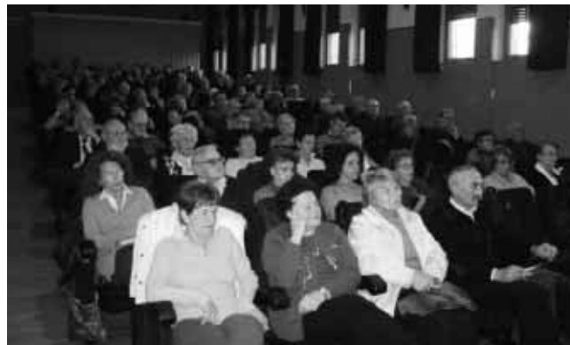
Relatori e convegnisti durante la conferenza sull’informazione, realizzata a Bassano del Grappa nei giorni 1-2 dicembre 2010, con la collaborazione de “Il Giornale di Vicenza”.

mescolano cose estranee, esse si contaminano. Basta mettere accanto una notizia politica ad un fatto mondano per deviare l’interpretazione della prima.